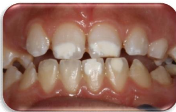
Figura 3. Hipocalcificação do esmalte

O esmalte hipocalcificado caracteriza-se com espessura normal na erupção, porém macio. É opaco, sem brilho, com coloração que varia do branco até o castanho claro, sendo tão macio que pode ser feita uma depressão com um instrumento 8 .