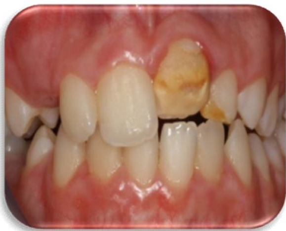
Figura 1. Hipoplasia de esmalte.

A hipoplasia do esmalte pode ser definida como uma formação incompleta ou defeituosa da matriz orgânica do esmalte dentário, descrita pela amelogênese imperfeita 4,5 .