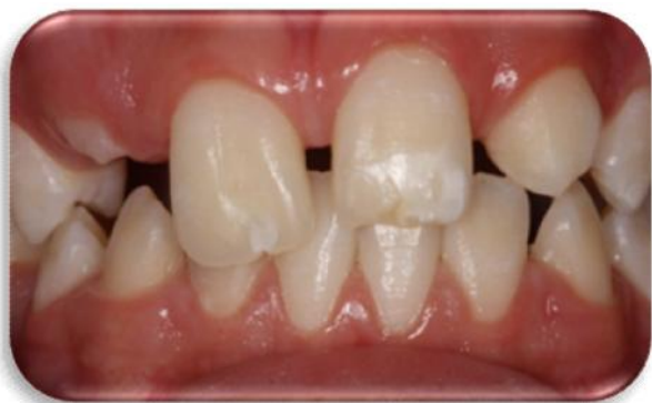
Figura 4. Hipocalcificação do esmalte.

relação às dentições decídua e permanente, apresente alta variabilidade, além disso, alguns autores 2 não observaram diferenças estatísticas significantes entre prevalência de opacidade demarcada e hipoplasia. O defeito de esmalte mais prevalente na dentição decídua foi a opacidade demarcada (20,9%), enquanto que na dentição permanente a opacidade difusa (26,2%) 2 .