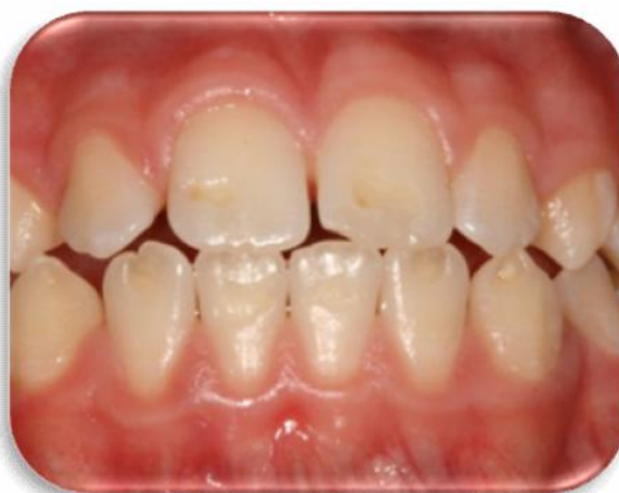
Figura 2. Hipoplasia de esmalte.

O esmalte hipocalcificado caracteriza-se com espessura normal na erupção, porém macio. É opaco, sem brilho, com coloração que varia do branco até o castanho claro, sendo tão macio que pode ser feita uma depressão com um instrumento 8 .