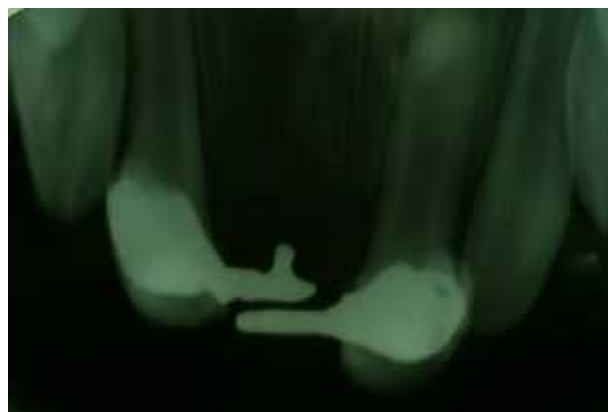
Figura 9. Radiografia Final