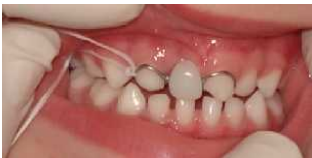
Figura 6. Prova da Prótese parcial fixa modificada

Realizou-se a higiene bucal da criança e posterior prova da peça protética (isolamento relativo). Esta foi amarrada com fio dental (Figura 6), prevenindo-se o risco de deglutição pela criança. Após, a peça foi cimentada com cimento resinoso dual na região interna da estrutura metálica dos dentes 52 e 61.