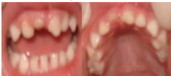
Figura 1. Aspecto clínico inicial frontal e palatino (dente 51)

Paciente do gênero feminino, 36 meses de idade sofreu traumatismo dentário, em consequência de uma queda. O exame clínico e radiográfico observou que o dente 51 apresentava fratura vertical de raiz, enquanto o dente 61 apresentava fratura coronária (ângulo) (Figuras 1 e 2). O plano de tratamento proposto foi a exodontia do dente 51 (Figuras 3 e 4), com posterior reabilitação do dente 51 e restauração do dente 61.