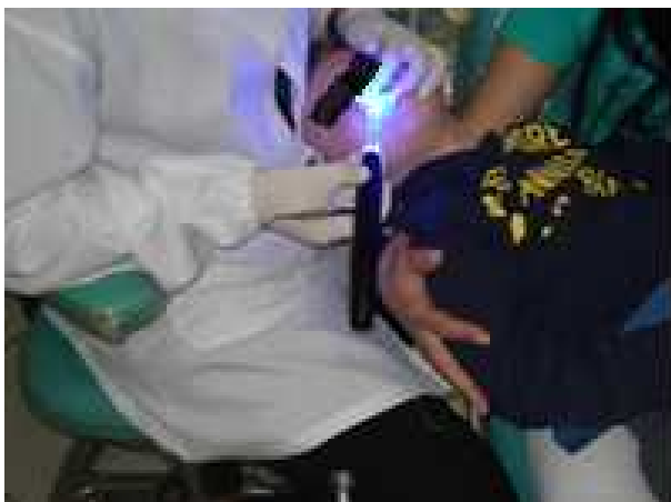
Figura 7. Cimentação e fotopolimerização da resina na prótese fixa estético-funcional tipo Denari nos dentes 52 e 61 (fraturado).

Na face vestibular dos mesmos dentes realizou-se o condicionamento com ácido fosfórico por 30 segundos. Após lavagem e secagem, usou-se o sistema adesivo nos dentes 52 e 61 e posteriormente a inserção da resina composta Z 100 – 3 M cor 61, recobrimo a porção metálica vestibular com o objetivo de melhorar a estética. Procedeu-se à remoção dos excessos da resina e fotopolimerização (durante o procedimento, a criança permaneceu no colo da mãe, cooperando de forma parcial) (Figura 7).