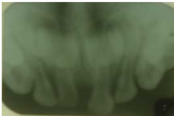
Figura 2. Radiografia Inicial