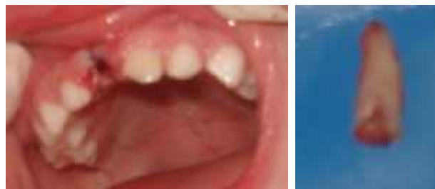
Figura 3. Pós-cirúrgico do dente 51 (pós-sutura) - esquerda; Fragmento de raiz do dente 51 (fratura vertical) - direita.