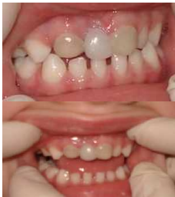
Figura 8. Prótese fixa estético-funcional tipo Denari instalada

dentária e gengivite. Também se recomendou, os períodos de retorno semestrais para o monitoramento desta prótese.