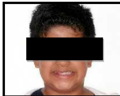
Figura 2. Imagem do paciente sorrindo, com ausência de vários elementos, função e estética comprometidos.

Quanto aos elementos permanentes da maxila do lado direito, encontravam-se ausentes; na maxila do lado esquerdo e mandíbula se encontram também normais de acordo com a cronologia de erupção (Figuras 2,3).