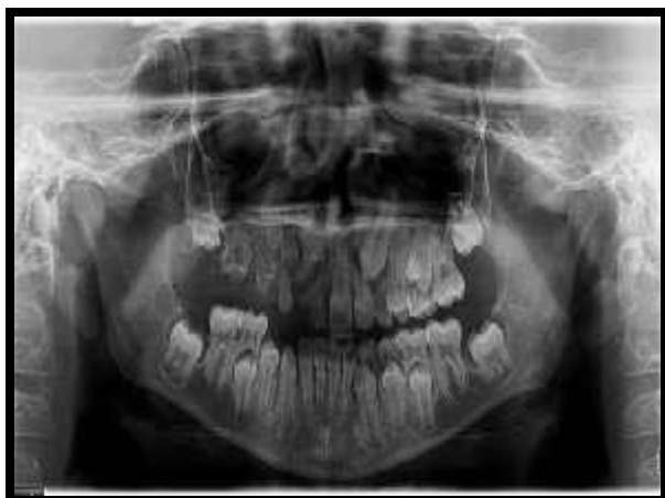
Figura 3. Radiografia panorâmica em que verifica-se a presença de dentes fantasmas no hemiarco superior direito.

Na arcada inferior mostrando os elementos dentários presentes e sua cronologia de erupção normal.