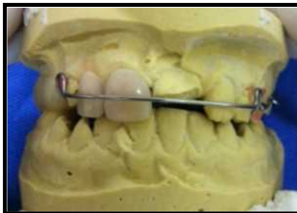
Figura 6. Placa de Hawley com expansor e com dentes de acrílico.

Também foi constatada através dos cortes transagiais a presença de reabsorção radicular externa no elemento 22 (Figura 5).