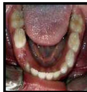
Figura 1. A