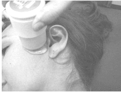
Figura 1. Aplicação do ultra-som em região da ATM.

Para a análise final dos dados foi utilizada a estatística descritiva, com o uso do programa Excell do Microsoft Office 2000 , e o teste de Mann-whitney com uma significância estatística de \alpha = 0,05 , utilizando o programa Minitab.