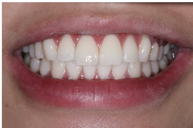
Figura 12. Sorriso final.