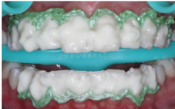
Figura 9. Agente clareador em todos os elementos.

(Total Blanc Office Dessensibilizante, DFL, Rio de Janeiro/RJ). Em seguida, poliu-se as superfícies vestibulares dos dentes utilizando o disco de feltro e pasta de polimento (Diamond Excel e Diamond Pro, FGM, Joinville/SC).