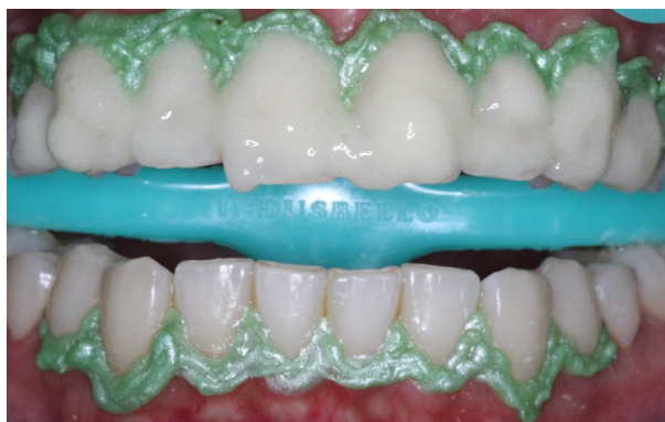
Figura 4. Agente clareador nos elementos superiores.