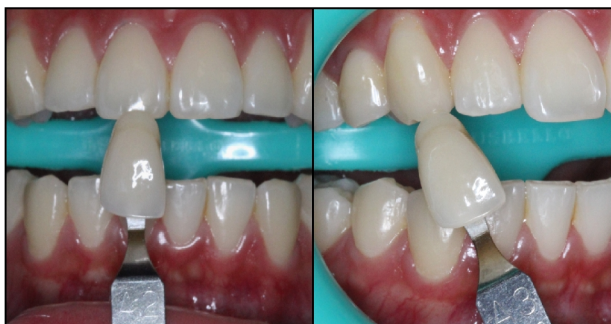
Figura 2. Escala de cor inicial.

As etapas clínicas foram realizadas com afastador labial Expandex (Indusbello, Londrina/PR) para proteção dos lábios e bochechas e com o auxílio de um sugador de saliva de alta potência. Inicialmente determinou-se a cor dos dentes, com a escala visual Esthet-X (Dentsply, Petrópolis/RJ). Os incisivos centrais superiores apresentaram coloração A2 e os caninos A3, as alterações de tonalidade dos elementos foram atribuídas principalmente aos fatores extrínsecos (Figura 2).