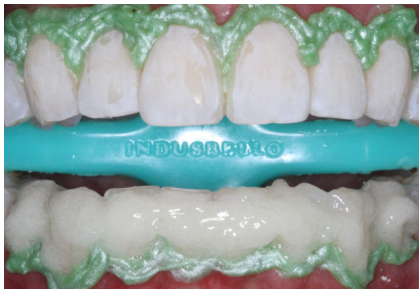
Figura 7. Agente clareador nos elementos inferiores.