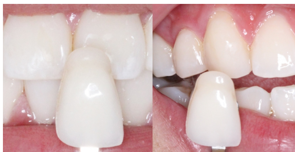
Figura 11. Escala de cor final.

Concluídos todos os procedimentos, foi realizada uma nova seleção de cor, com a mesma escala, na qual os dentes de referência, incisivo central superior e canino superior apresentaram cor A1, constatando-se a efetividade imediata do clareamento (Figuras 11 e 12). Embora durante todas as etapas clínicas a paciente não tenha qualquer sensibilidade, juntamente com as orientações verbais e escritas de cuidados gerais com o tratamento, foi prescrito um bochecho diário com fluoreto de sódio a 0,025% por 30 dias.