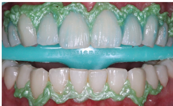
Figura 3. Condicionamento ácido dos elementos superiores.

zou-se a manipulação do gel clareador, com o uso das seringas acopladas do Peróxido de Hidrogênio a 35% e Espessante (Total Blanc Office 35%, DFL, Rio de Janeiro/RJ). Quando homogeneizado, uma camada de gel com 1 mm de espessura foi cuidadosamente aplicada sobre a superfície vestibular dos dentes, evitando-se total contato com os tecidos moles. O conjunto foi então fototivado por 03 vezes, durante 03 minutos com intervalo de 01 minuto, com uso de laser (Whitening Lase II, DMC, Florida/USA), seguindo a irradiância recomendada pelo fabricante de 350 mW/cm 2 . Em seguida, removeu-se o agente clareador dos dentes superiores que foram então hidratados. Após um intervalo de 15 minutos, o processo se repetiu no arco inferior (Figuras 3 a 8).