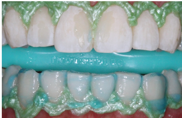
Figura 6. Condicionamento ácido dos elementos inferiores.

Concluída a primeira aplicação em ambas arcadas, o gel foi por mais duas vezes sobreposto, mas desta vez em todos os dentes de trabalho simultaneamente. Os procedimentos de fotoativação, remoção, hidratação e o intervalo entre as aplicações, foram executados igualmente as etapas anteriores (Figuras 9 e 10).