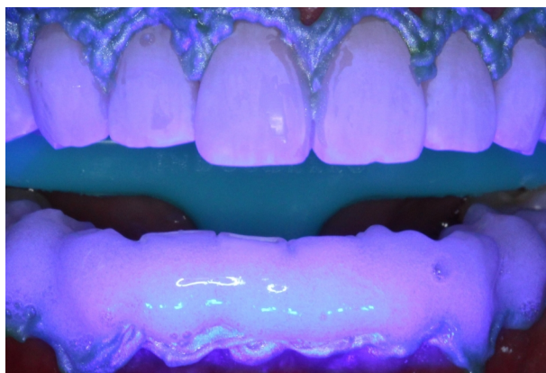
Figura 8. Ativação do Laser sobre o gel inferior.

Finalizada a etapa clareadora, as barreiras de proteção gengival foram removidas e sobre os dentes foram aplicados um agente dessensibilizante por 5 minutos