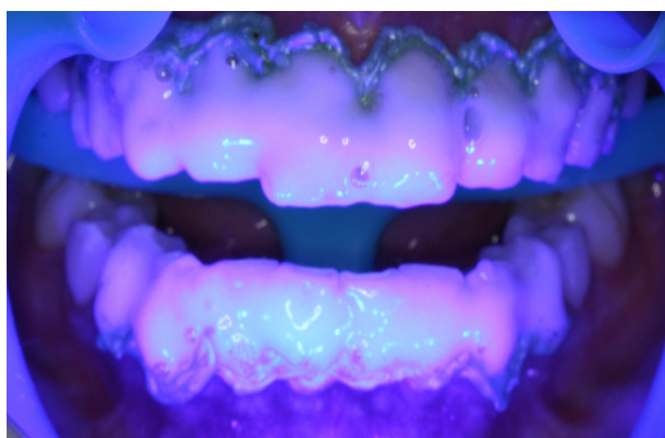
Figura 10. Ativação do Laser sobre o gel clareador.

Concluídos todos os procedimentos, foi realizada uma nova seleção de cor, com a mesma escala, na qual os dentes de referência, incisivo central superior e canino superior apresentaram cor A1, constatando-se a efetividade imediata do clareamento (Figuras 11 e 12). Embora durante todas as etapas clínicas a paciente não tenha qualquer sensibilidade, juntamente com as orientações verbais e escritas de cuidados gerais com o tratamento, foi prescrito um bochecho diário com fluoreto de sódio a 0,025% por 30 dias.