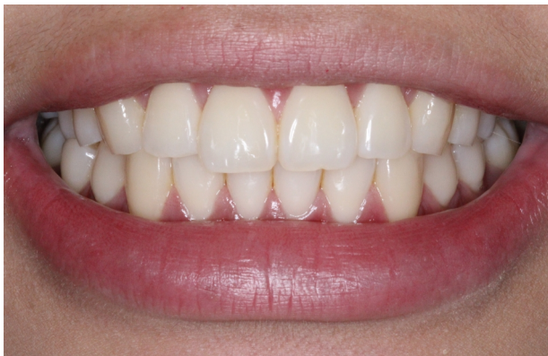
Figura 1. Sorriso Inicial.

ciente relatou não apresentar sensibilidade dentária espontânea ou decorrente da aplicação de jato de ar ou ao exame de percussão, bem como negou a realização anterior de qualquer modalidade clareadora. Diante da normalidade clínica constatada e do caráter urgêncial, foi proposta a realização de clareamento dentário de consultório em sessão única, com peróxido de hidrogênio a 35%, com o uso de luz coadjuvante (Figura 1).